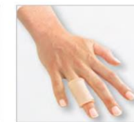
Finger sleeve Medigel Z®